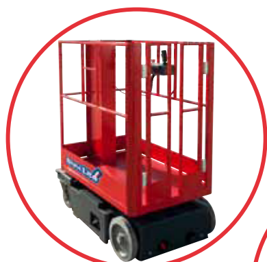
Compact & Powerful