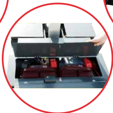
Integral fork pockets